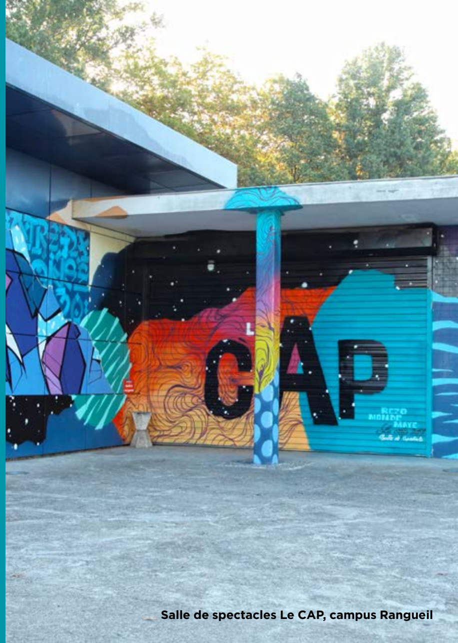
Salle de spectacles Le CAP, campus Rangueil

L'université met à disposition de tous une adresse courriel institutionnelle que les étudiantes et les étudiants doivent utiliser. Cette adresse nominative permet de recevoir des informations administratives (scolarité, BU, lettres d'informations